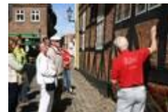
Guiden fortæller om Ebbe Mogensens Gavlhuis

På hjørnet af Sortebrødregade og gågaden, Overdammen, ligger Ebbe Mogensens Gavlhuis, der blev bygget lige efter den store brand i 1580. Næsten alle bindingsværkshuse i Ribe er opført kort efter bybranden i 1580, og Ribe er den by i Danmark, hvor der er bevaret flest huse fra 15- og 1600-tallet.