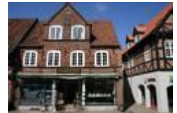
Overdammen 1 og Tingslippe

Gå tilbage til hovedgaden (Overdammen) og drej til højre. Lige før torvet kommer I til en smal slippe kaldet Tingslippe, den førte tidligere ind til Ribes tingsted og Rådhus, som førhen lå Grønnegade 2. Her foregik rettergangen ved Riber Ret under åben himmel.