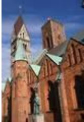
Ribe Domkirke og Brorson

11. I går nu ned mod Domkirkens sydside og vil opdage, at kirken ligger langt under gadeplan. I sin tid blev den bygget på en lille indlandsklit et par meter over gadeplan. På grund af århundredes ophobning af byggemateriale og affald har omgivelserne hævet sig. Måske er noget af ophobning lavet bevidst p.g.a. stormflodsfare. Jo højere byen lå, des mindre risiko for oversvømmelse. Ribe Domkirke er den eneste 5-skibede kirke i Danmark. Den blev påbegyndt ca. 1150 og stod færdig ca. 1250. Mindst 2 danske konger er begravet her, nemlig Erik Emune († 1137) og Christoffer 1 († 1259). Prøv at lytte til kirkens smukke klokkespil. Det spiller hver dag kl. 12 og 15 melodien om Dronning Dagmar . (Lyt og læs om Dronning Dagmar på linket). Kl. 8 og 18 spiller det Brorsons salme: Den yndigste rose er fundet.