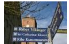
Ribes seværdigheder står i kø i Ribes centrum