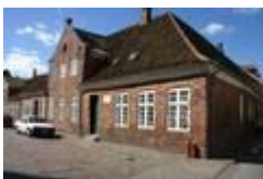
Den gamle latinskole

14. Gå lidt til højre i Skolegade. I bygningen på hjørnet af Skolegade og Grydergade fungerede fra ca. 1500 til midt i 1800-tallet Den Gamle Latinskole (Domscole - Katedralskole). Skolen var dengang kendt i hele Danmark og havde mange elever fra hele landet.