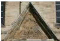
Trekantrelief fra 1200-tallet

Relieffet viser måske Kong Valdemar Sejr, som rækker et kors til Jomfru Maria. Ved kongens side ses hans anden dronning, Bengerd, og nedenunder kongens hoved ses Dronning Dagmars hoved. I en anden fortolkning er kongen på billedet Valdemars søn Kong Christoffer I, der blev begravet i Ribe Domkirke. Han havde været i en voldsom konflikt med kirken, men bad om tilgivelse ved sit dødsleje - og fik den, så han kunne få en kongelig begravelse og kirkens velsignelse.