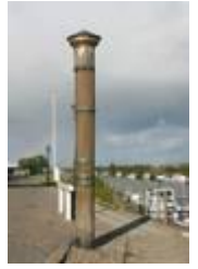
Stormflodssøjlen i Ribe

Ribe Diget blev bygget i 1912, og selv om der har været store stormfloder siden, har vi ikke haft vand i Ribes gader på grund af oversvømmelser, selv om vandet ofte står helt op til volden ved Danhostel Ribe. Se video og læs mere om stormfloder i Ribe her: Stormfloder Skibbroen nr. 19 har opsat et bræt med markeringer af flere af stormfloderne.