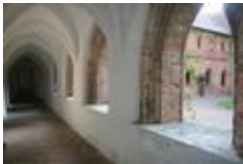
Ribe Kloster - Sct Catharinae