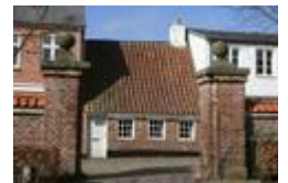
Ribes mindste hus

I fortsætter til venstre ad Gravsgade, til venstre ad Hundegade og kommer til højre til Klostergade. På højre side ligger Sct. Catharinae Kirke og Kloster og på venstre en række mindre huse kaldet Sjæleboderne. De blev bygget til fattige mennesker. Nr. 26 er Ribes mindste hus og fra 1500-tallet, det er samtidig det eneste af disse huse, der har undgået større forandringer. Det er 26,5 m 2 og i 1930 boede der en familie på 9 personer.