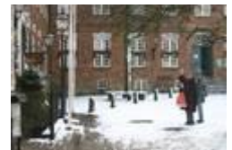
Porsborg og Hotel Dagmar pyntet til Peters Jul