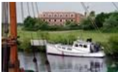
Hovedengen og Ribe Å ved Danhostel Ribe