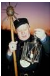
Ribes vægter med lygte og morgenstjerne

Her var byens gældsfængsel, som nu er et lille museum, der fortæller om Riber Ret. Museet indeholder bl.a. bødlens sværd og vægterens morgenstjerne. Se under Museer og Oplevelsescentre . Ribes retsregler fra middelalderen havde ry for at være strenge, og kendes fra disse "kællingens" bevingede ord, da hun så sin søn hænge i Varde galge: "Tak Gud, min søn, at du ikke kom for Riber Ret ".