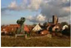
Dronning Dagmar på Riberhus Slotsbanke