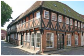
Puggårdsgade nr. 2