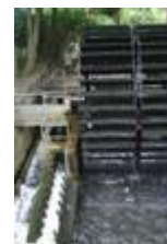
Ydermøllen - vandmøllen ved Nørreport