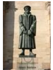
Reformatoren Hans Tausen (Tavsen)

13. Når I går forbi statuerne af Ansgar, Brorson og Hans Tausen statuen, kommer I på venstre side forbi et rødt hus (hjørnet til Skolegade). Det hedder Hans Tausens Hus og er den sidste rest af den gamle bispegård. Hans Tausen (1494 - 1561) var biskop i Ribe kort efter reformationen og betragtes som den danske reformations hovedskikkelse.