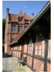
Tårnborghuset og boderne

Lidt længere nede ad Puggårdsgade kommer I på venstre hånd forbi Tårnborghuset, som blev bygget af adelsmanden Oluf Munk i 1540'erne. Navnet fik det på grund af trappetårnet. Da salmedigteren Brorson var biskop i Ribe, boede han her. De to små fine bindingsværkshuse ved siden af Tårnborghuset er bygget næsten samtidig. De kaldes boder og er Ribes første rækkehuse. Boderne blev beboet af småborgere og arbejdsmænd, som lejede husene af rigmænd.