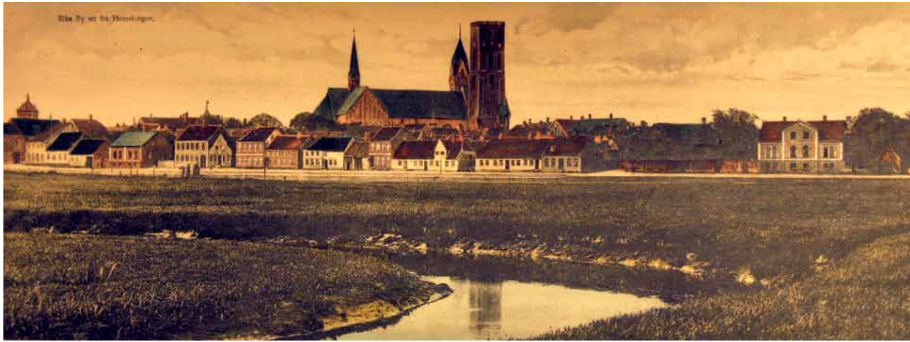
Håndkoloreret fotografi af Skibbroen set fra Hovedengen.