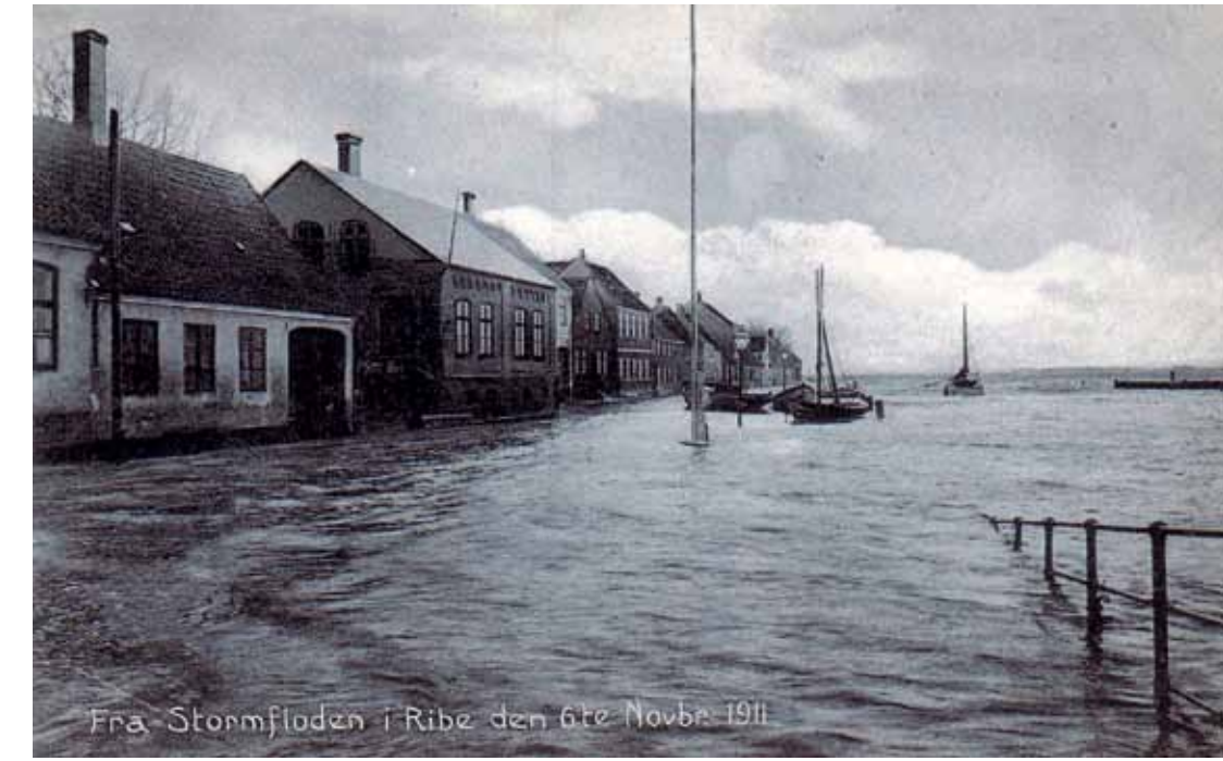
Fra Stormfloden i Ribe den 6. november 1911.